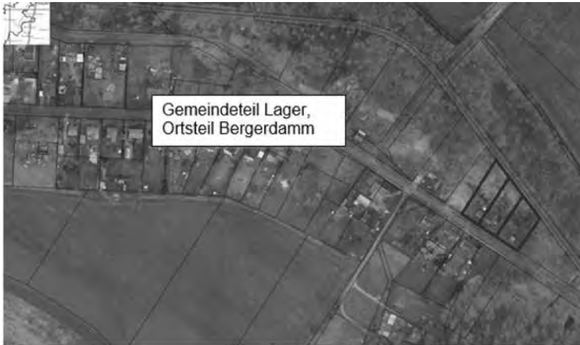
Lageskizze Geltungsbereich Bebauungsplan „Lindenweg 1 - 3“: