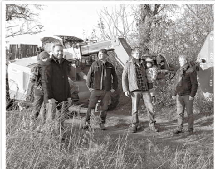
Freude bei allen Beteiligten über den Start des Projektes Apfelweg in Groß Behnitz.