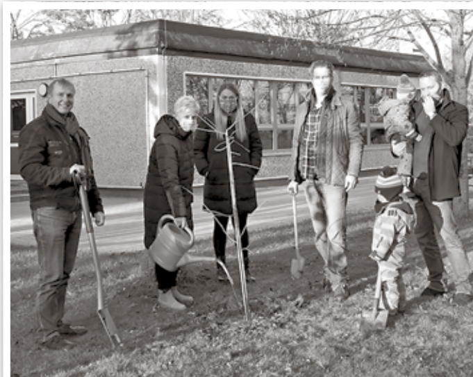
Die ersten drei Obstbäumchen wurden gepflanzt