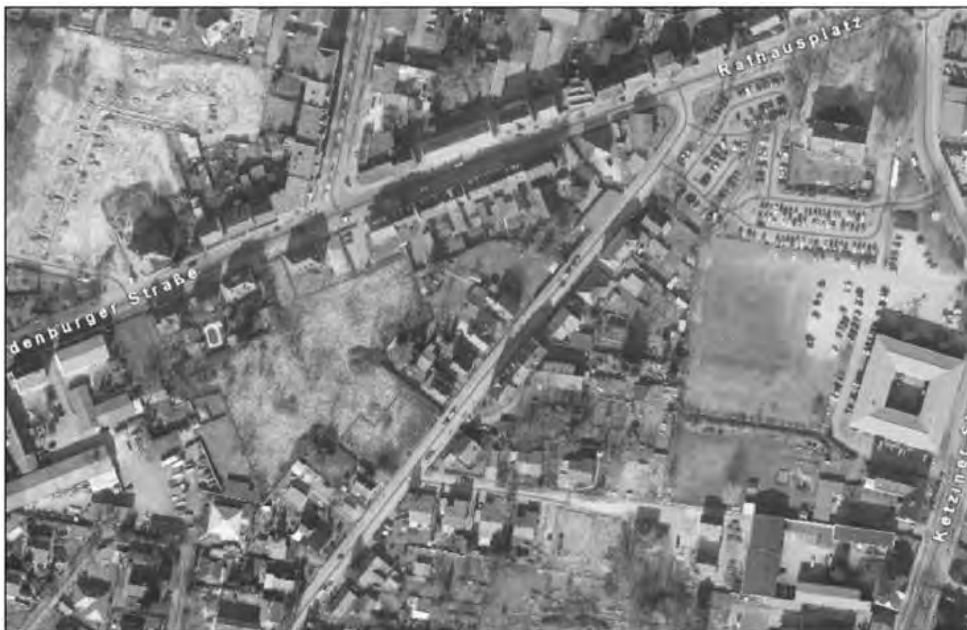
Übersichtskarte (ohne Maßstab)