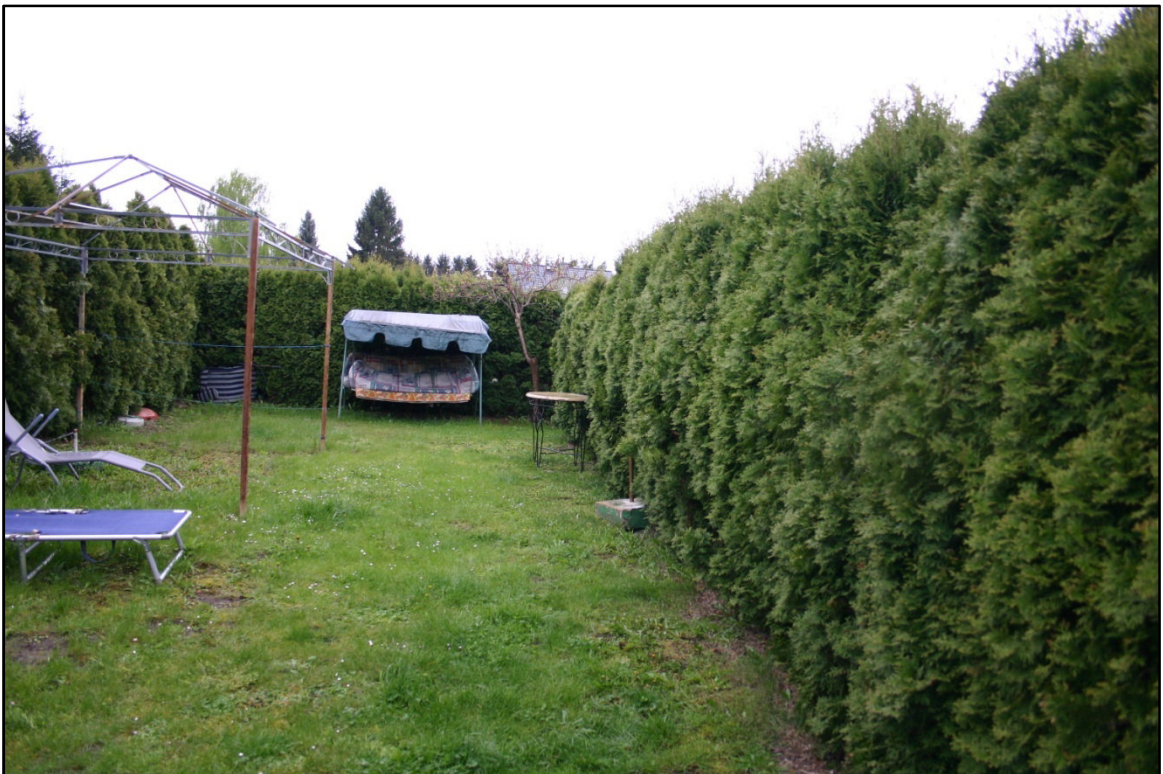
Abbildung 8: Von Hecken separat umrahmte Aufenthaltsfläche innerhalb des Gartens, 25.04.2017