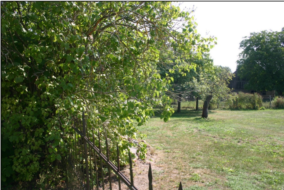
Abbildung 5: Blick von Nord nach Südwest in den Garten des PG hinein, 01.09.2016