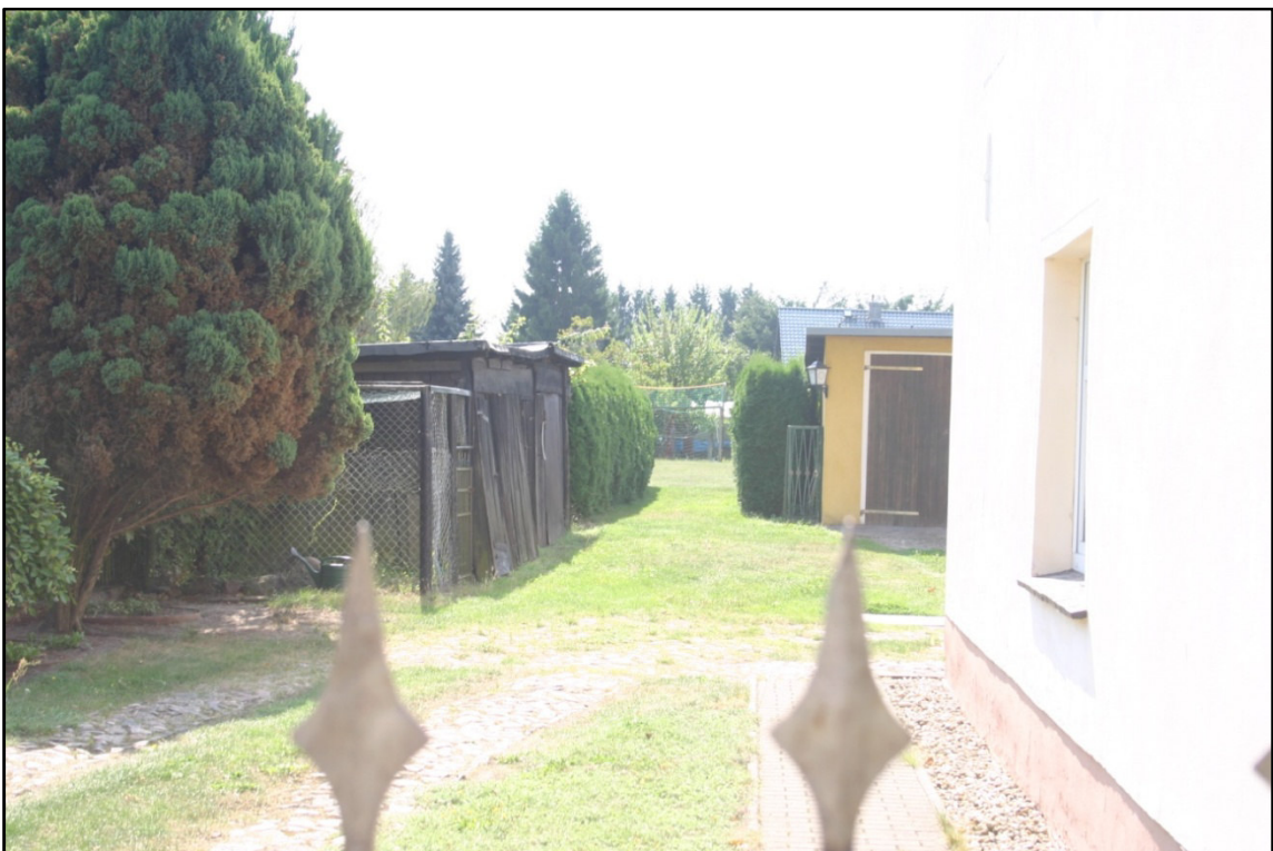
Abbildung 4: Eingangssituation mit Blick auf die Garagen rechts hinter dem Haus und den Schuppen links, 01.09.2016