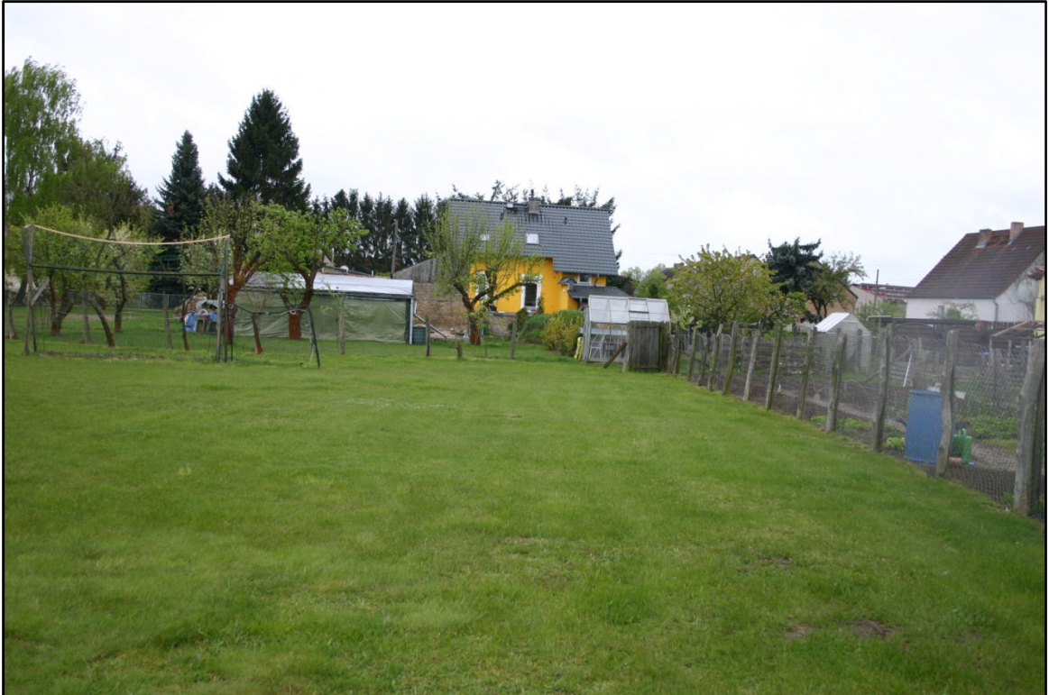
Abbildung 7: Nord-Süd-Blick entlang der östlichen PG-Grenze, die Anbaufläche ist grundstücksintern, 25.04.2017