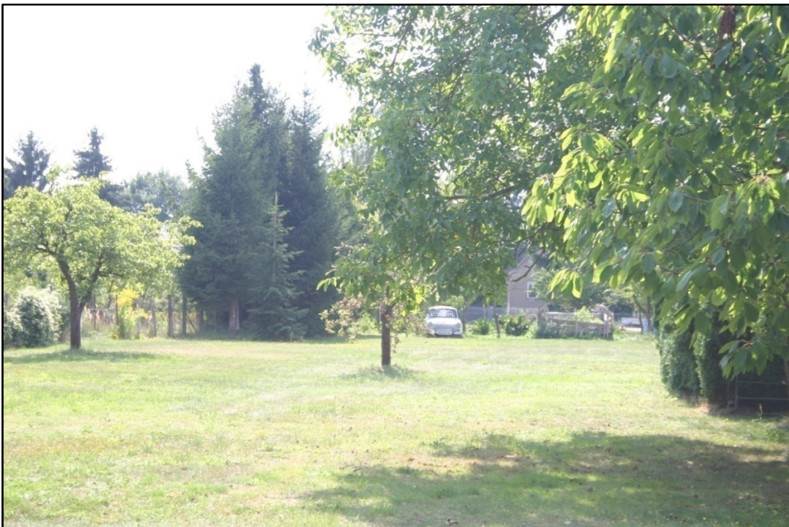
Abbildung 6: Nord-Süd-Blick in die Tiefe des PG hinein bis zum südlichen Grenzzaun, 01.09.2016