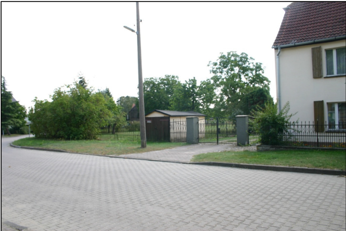
Abbildung 3: Außenansicht mit Blick auf die nördliche Plangebietsgrenze, 01.09.2016