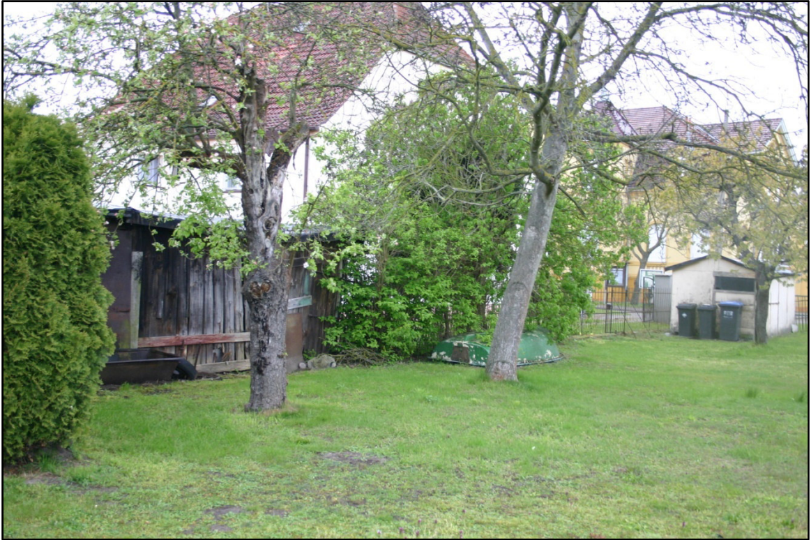
Abbildung 9: Blick zurück in nordöstliche Richtung auf die Schulstraße, 25.04.2017