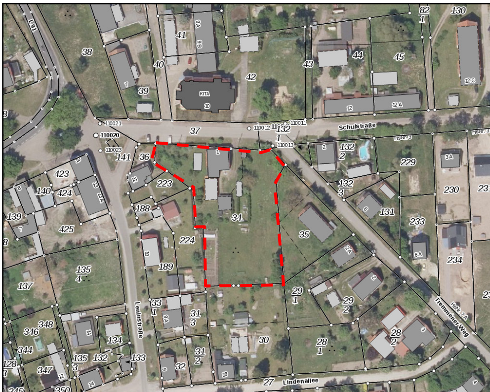
Abbildung 1 Auszug Brandenburg-Viewer mit Umgrenzung Plangebiet (o.M.)

Topographisch wirksam können die Wachower Dorfkirche und die Alt-Eiche am Wendekreis an der Dorfeinfahrt „Zum Seefeld“ hervorgehoben werden. Es liegt kein Potenzial für eine ein- oder gegenseitige visuelle Beeinträchtigung vor. Direkt gegenüber dem Plangebiet liegt das ebenfalls ortsbildprägende Gebäude des Dorfgemeinschaftshauses. Weitere nennenswerte topographische Elemente können aus Sicht des Plangebietes nicht festgestellt werden.