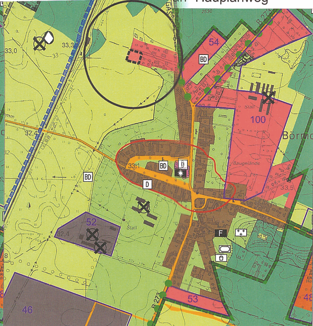
GEPLANTE DARSTELLUNG M 1:10.000 - Blatt 2 (Ausschnitt)